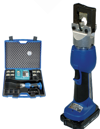
Art. EK354L/Miete pro Woche *89.50 (M)