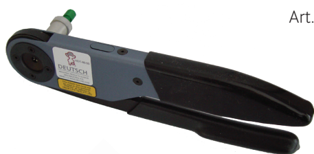
Art. HDT48/Miete pro Woche *24.50 (M)

Die passenden Presseinsätze liegen bei und die Rücksendung erfolgt mit beigelegter Rücksende-Etikette.